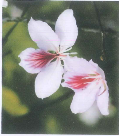
Hình ảnh hoa Ban đặc trưng của núi rừng Tây Bắc