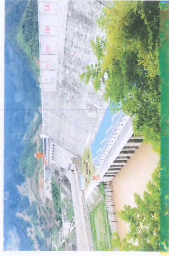
Hình ảnh công trình thủy điện Sơn La lớn nhất Đông nam á