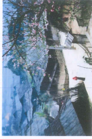
Hình ảnh mái nhà đặc trưng của đồng bào dân tộc Thái và khu du lịch cộng đồng Ngọc Chiến