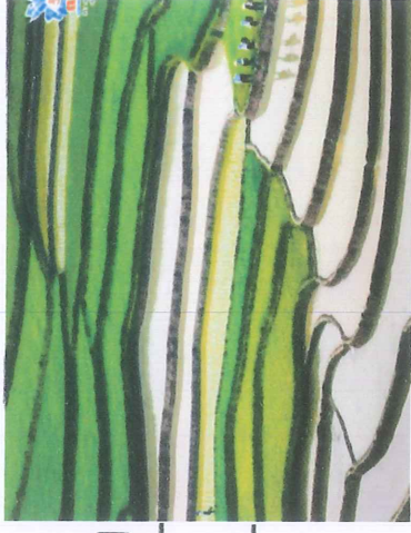
Ruộng bậc thang và những cung đường